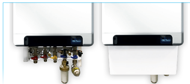
Versione con copriconessioni