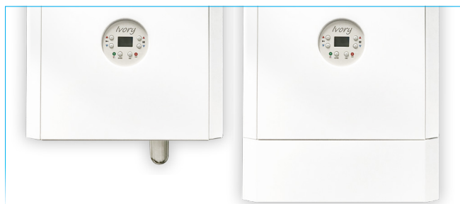
Versione con copriconessioni